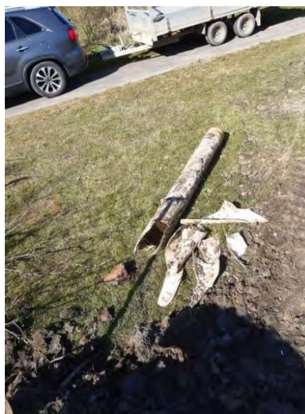
Vernieling buis beregeningsinstallatie. Schade: bijna 4000 euro.